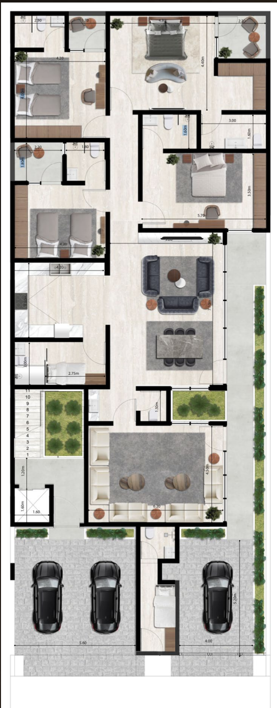
الطابق الأرضي GROUND FLOOR