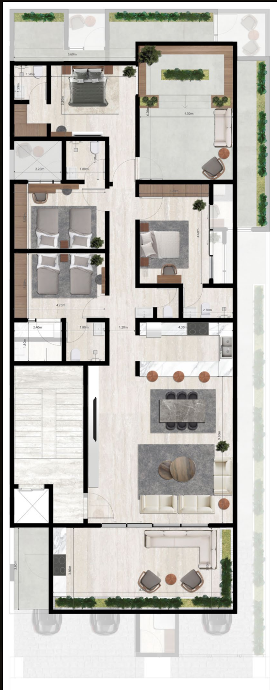
الطابق الثاني SECOND FLOOR