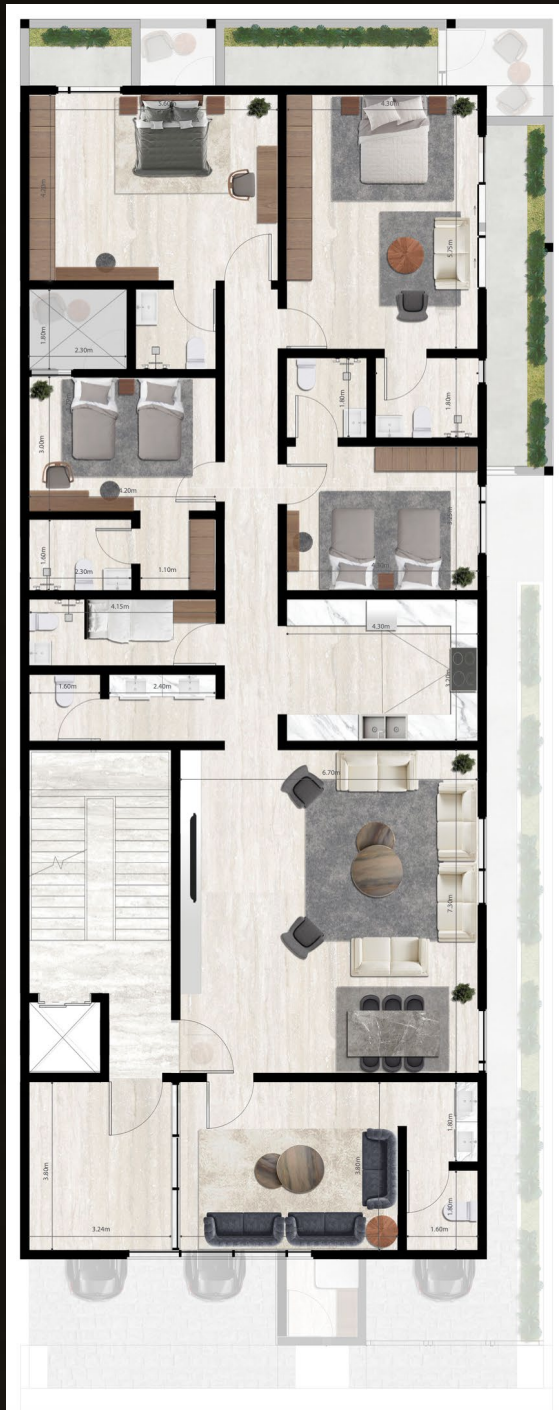
الطابق الأول FIRST FLOOR